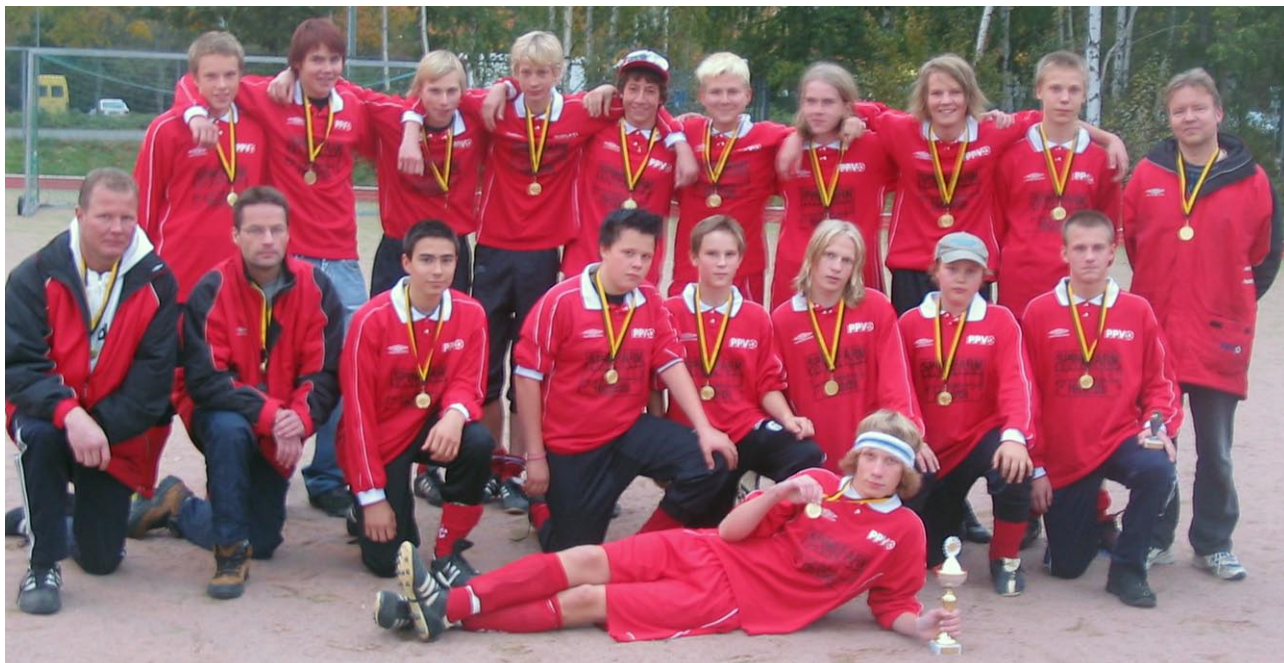
Kuva 1. PPV-89 joukkueen pelaajia voittoisan Tapiola turnauksen jälkeen (lokakuu 2004)