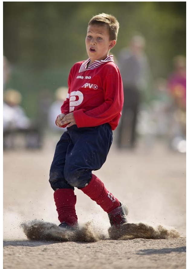
Kuva 4. Pysähtyäkkin pitää