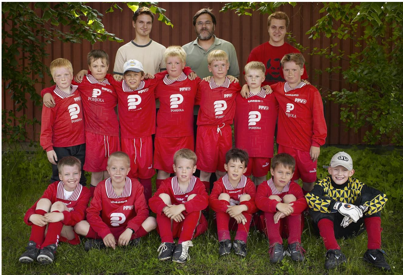
Kuva 1. Helsinki-Cup 2004