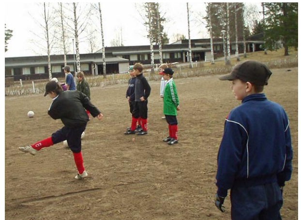
Pojat treenaamassa. Täältä näyttää kunnon rintapotku.