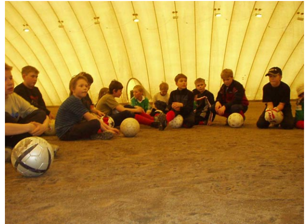
Ei enään hiekkakakkuja, tässä tässä osataan jo kuunnella.