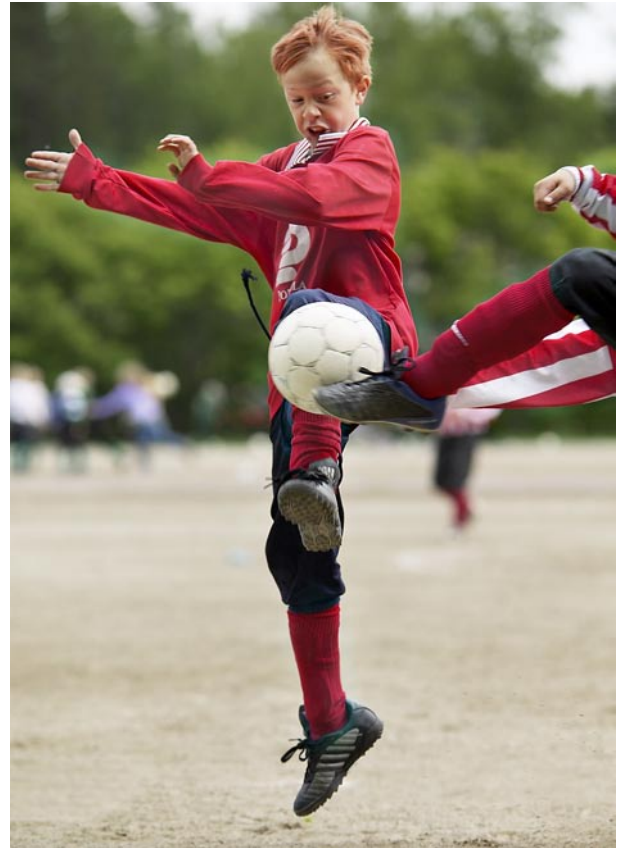
Kuva 3. Armoton taistelu