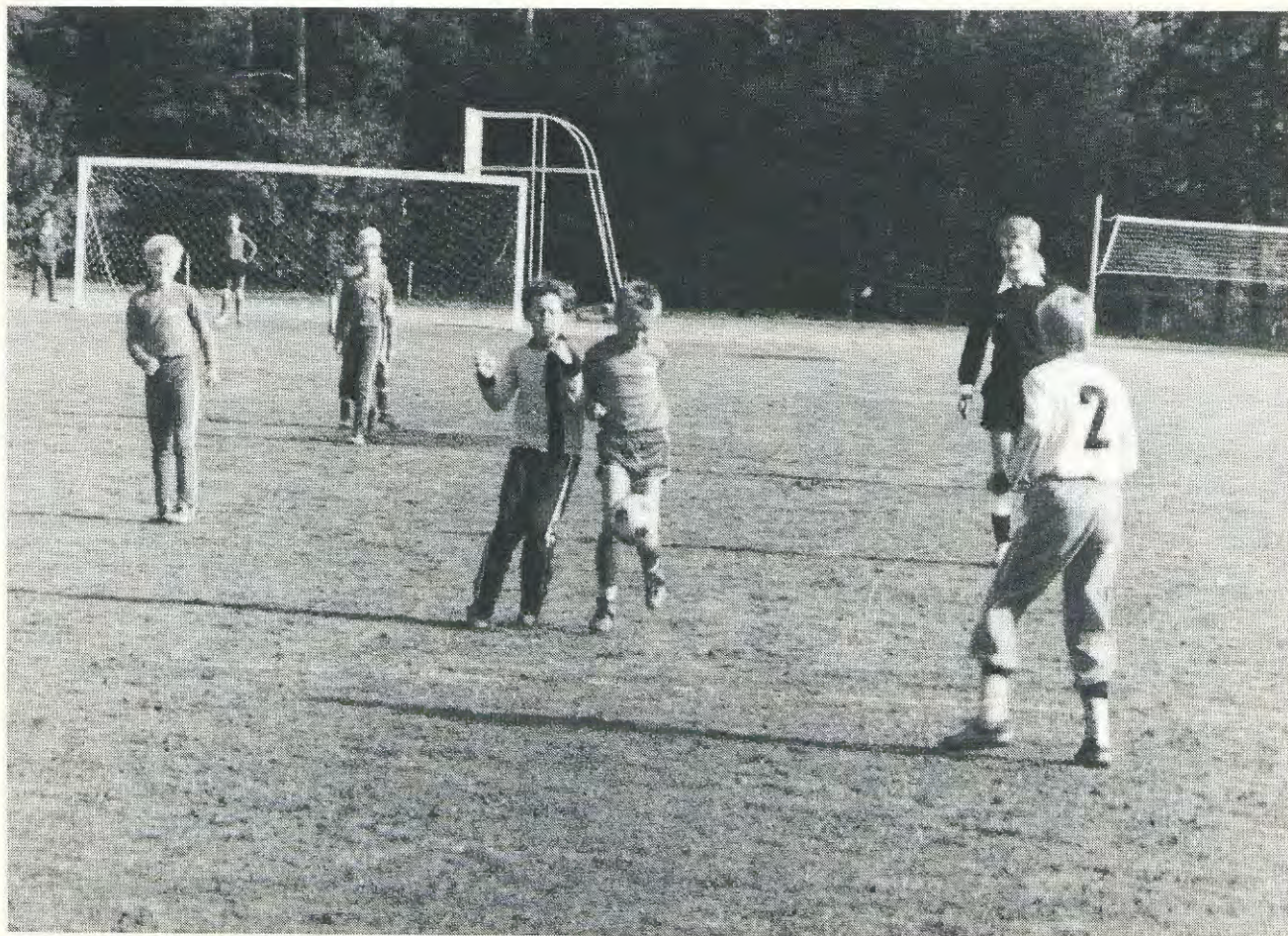
Kuva ottelusta Pitäjänmäen Tarmo D — Pajamäe Pallo-Veikot D, joka päättyi tasan 1-1.