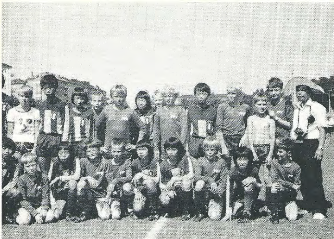
Taiwanilainen Shuang-Lien D-juniorit ja PPV:n D-juniorit Helsinki-Cupissa.